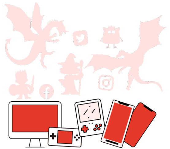
カタチのない「モノ」にも対応

デジタルお焚き上げは、デジタルなモノや思い出を供養するための現代の新しいお焚き上げです。リアルグッズのお焚き上げと同様、供養したいモノとあなたの思いをオンライン上の「形代（かたしろ）」に記入して申し込むと、神田明神でお焚き上げをして供養いたします。お焚き上げ証明書、御守、絵馬はご自宅にお届けいたします。（*お焚き上げの対象となるSNS等のアカウント削除は必要に応じてご自身で行っていただきます。）